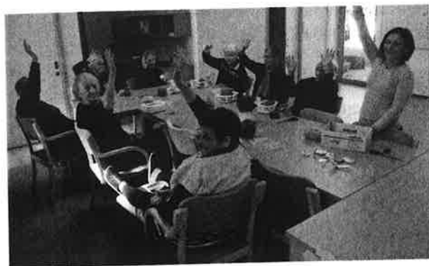
Otvoritev Hiše dobre volje, dne 15. 10. 2018

Vsako leto sofinancirajo socialne in humanitarne programe, namenjene starejšim, bolnim in socialno ogroženim. V pripravi so, kot povedo, tudi pilotni projekti sodelovanja med različnimi humanitarnimi organizacijami v občini. »Kar nekaj dela nas čaka, da postanemo invalidom prijazna občina, saj je prilagoditev infrastrukture finančno zelo zahtevna. Z gradnjo dvigal in klančin v javnih objektih in prilagajanjem zunanje infrastrukture bomo pospešeno nadaljevali tudi prihodnja leta, kar smo zapisali tudi v celostni prometni strategiji občine,« še dodajo.